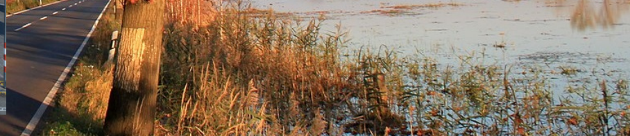
Nov. 5th, 2021