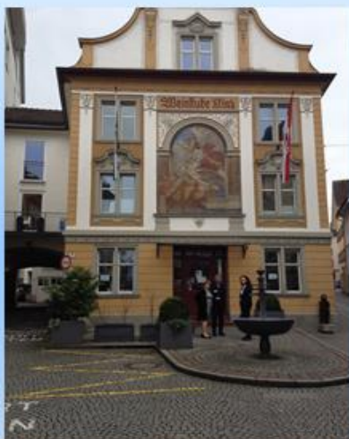
Weinstube Kinz neben Gasthaus Goldener Hirschen